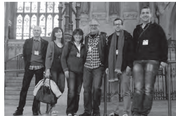
Vorstandsausflug nach London und Besuch der «Houses of Parliament», Mai 2015