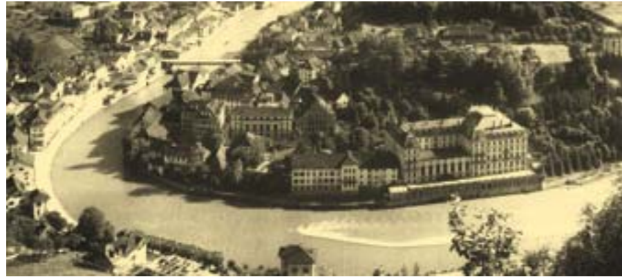
Baden im 19. Jahrhundert

gehen im April 2008 einstimmig zu. Für das Konkurrenzverfahren wurden 5 renommierte Architekturbüros eingeladen. Die Jury, welche die Eingaben bewerten musste, setzte sich aus Fach- und Sachjuroren zusammen. Einstimmig wählte die Jury das Projekt von Mario Botta als Siegerprojekt aus und empfahl, dieses Projekt weiterzuentwickeln.