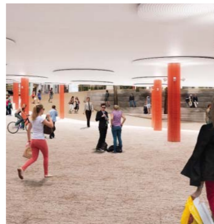
Schulhausplatz mit Fussgänger- und Velopassage

Zudem wurde mit dem Bau der Parkhäuser Gstuhl und Theaterplatz im Vorfeld bereits Ersatz geschaffen. Die Vorteile des Gesamtpaketes überwiegen also deutlich.