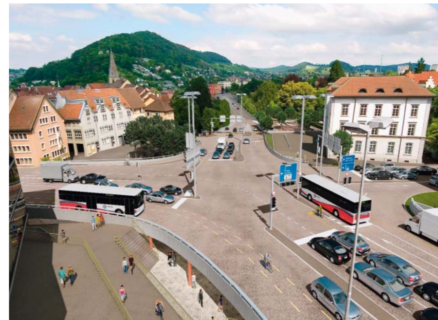
Gesamtansicht von Westen