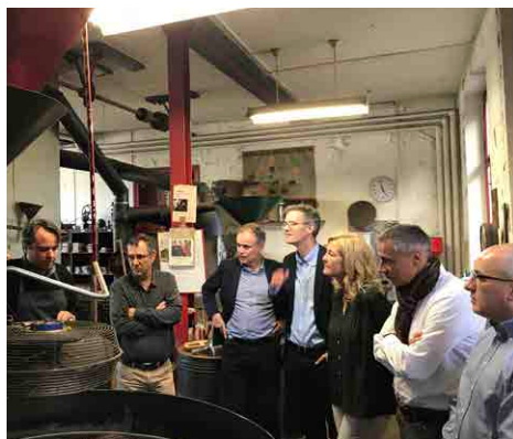
Vorstands- und Fraktionsausflug nach Dietikon in die Kaffeerösterei Ferrari