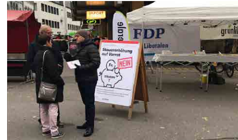
Standaktion zur Steuerfussabstimmung