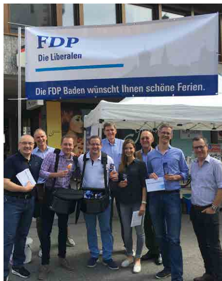
Standaktion im Juli

Unsere Postadresse: FDP Stadtpartei Baden c/o Oliver Steger Rütistrasse 14 5400 Baden